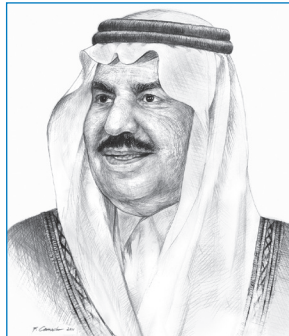
صاحب السمو الملكي الأمير نايف بن عبدالعزيز آل سعود ولي العهد نائب رئيس مجلس الوزراء وزير الداخلية