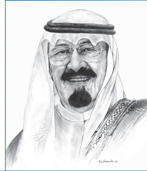
خادم الحرمين الشريفين الملك عبدالله بن عبدالعزيز آل سعود