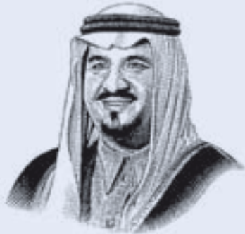
صاحب السمو الملكي الأمير سلطان بن عبدالعزيز آل سعود ولي العهد نائب رئيس مجلس الوزراء وزير الدفاع والطيران والمفتش العام