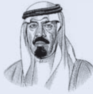
خادم الحرمين الشريفين الملك عبدالله بن عبدالعزيز آل سعود