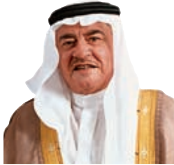
عبدالله إبراهيم سلسلة