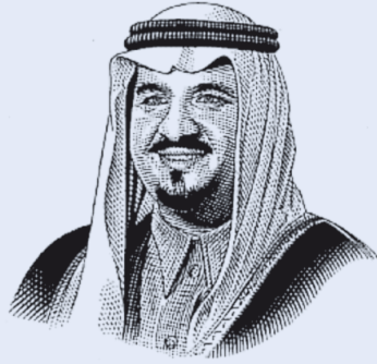
صاحب السمو الملكي الأمير سلطان بن عبدالعزيز آل سعود ولي العهد و نائب رئيس مجلس الوزراء و وزير الدفاع والطيران والمفتش العام