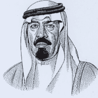
خادم الحرمين الشريفين الملك عبدالله بن عبدالعزيز آل سعود