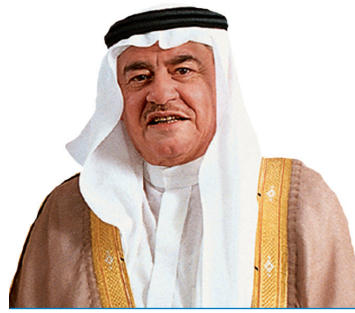
عبدالله إبراهيم سلسلة