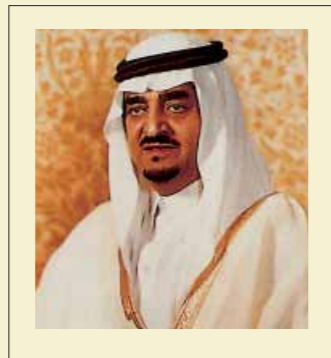
الملك فهد بن عبد العزيز آل سعود خادم الحرمين الشريفين