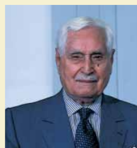
عبد المجيد عبد الحميد شومان