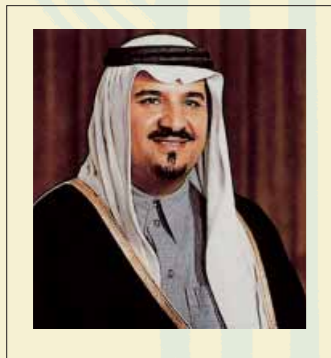
صاحب السمو الملكي الأمير سلطان بن عبد العزيز آل سعود النائب الثاني لرئيس مجلس الوزراء ووزير الدفاع والطيران والمفتش العام