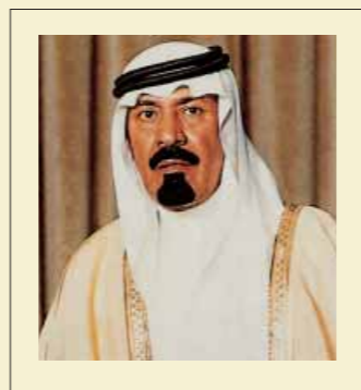
صاحب السمو الملكي الأمير عبد الله بن عبد العزيز آل سعود ولي العهد ونائب رئيس مجلس الوزراء ورئيس الحرس الوطني