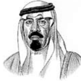
خادم الحرمين الشريفين الملك عبدالله بن عبدالعزيز آل سعود