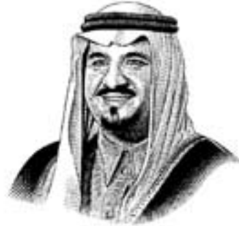
صاحب السمو الملكي الأمير سلطان بن عبدالعزيز آل سعود ولي العهد نائب رئيس مجلس الوزراء وزير الدفاع والطيران والمفتش العام