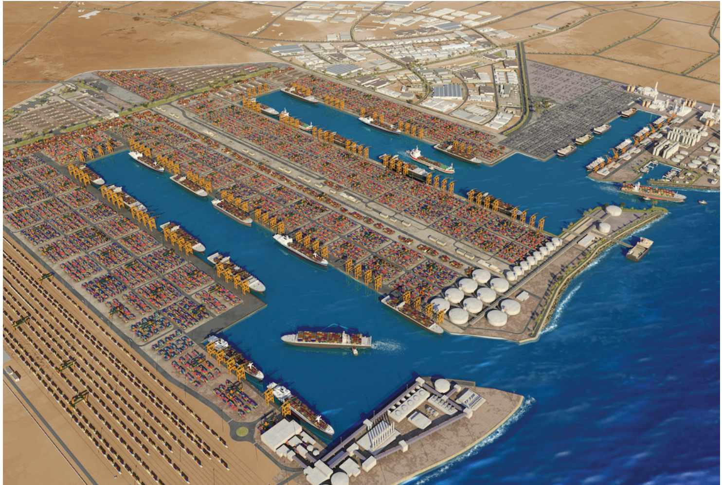
ميناء الملك عبد الله في مدينة الملك عبد الله الاقتصادية براغ - أحد المشاريع التي يساهم البنك بتمويلها