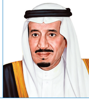
خادم الحرمين الشريفين الملك سلمان بن عبدالعزيز آل سعود