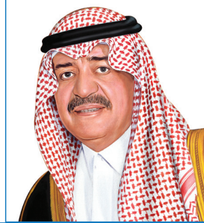
ولي العهد نائب رئيس مجلس الوزراء صاحب السمو الملكي الأمير مقرن بن عبدالعزيز آل سعود