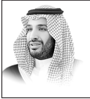
ولي العهد نائب رئيس مجلس الوزراء وزير الدفاع صاحب السمو الملكي الأمير محمد بن سلمان بن عبد العزيز آل سعود