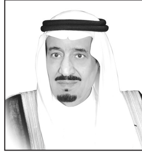
خادم الحرمين الشريفين الملك سلمان بن عبد العزيز آل سعود