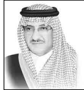
ولي العهد نائب رئيس مجلس الوزراء وزير الداخلية صاحب السمو الملكي الأمير محمد بن نايف بن عبد العزيز آل سعود