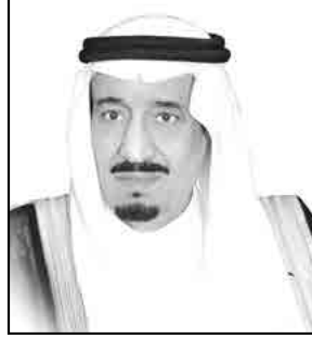
خادم الحرمين الشريفين الملك سلمان بن عبد العزيز آل سعود