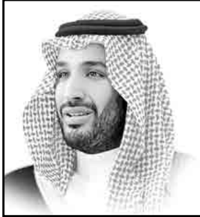
ولي ولي العهد النائب الثاني لرئيس مجلس الوزراء وزير الدفاع صاحب السمو الملكي الأمير محمد بن سلمان بن عبد العزيز آل سعود