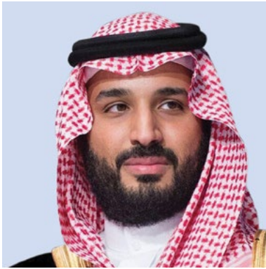
ولي العهد نائب رئيس مجلس الوزراء وزير الدفاع

صاحب السمو الملكي الأمير محمد بن سلمان بن عبد العزيز آل سعود